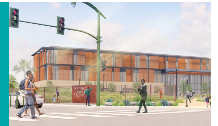
從 Third Street 和 Evans Avenue 所見的東南社區中心效果圖。