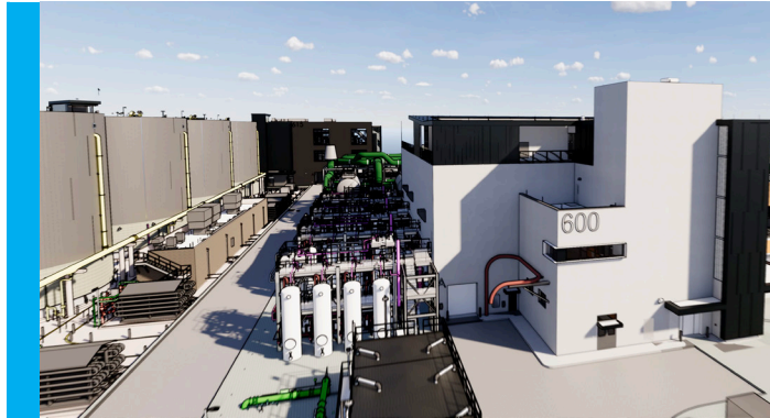
從 Jerrold Avenue 朝西北看的未來東南污水處理廠效果圖。

生化廢料消化池設施項目 (Biosolids Digester Facilities Project, 簡稱 BDFP) 將以更清潔、更環保的技術取代老化的設施。新設施將生產質素更高的生化廢料、更有效地收集和處理異味，以及充分利用沼氣。此外，項目會將消化池設在遠離現有住宅的地方，並美化 SEP 的內外景觀。 sfpuc.org/digesters